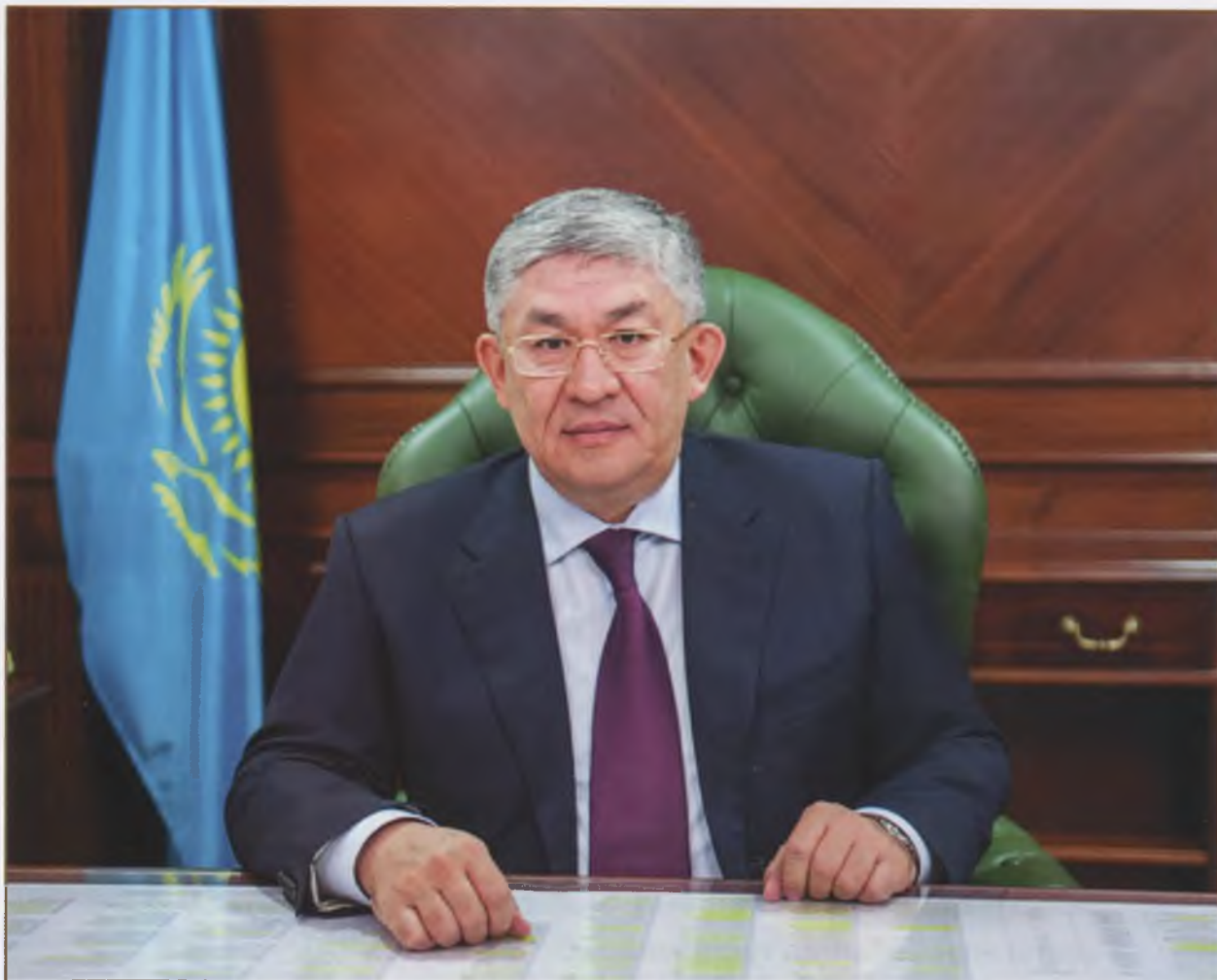
ҚЫРЫМБЕК КӨШЕРБАЕВ ҚАЗАҚСТАН РЕСПУБЛИКАСЫНЫҢ МЕМЛЕКЕТТІК ХАТШЫСЫ