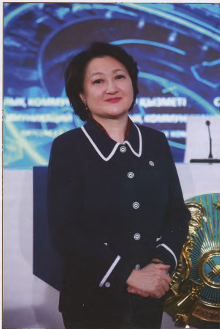
АҚТОТЫ РАЙЫМҚҰЛОВА ҚАЗАҚСТАН РЕСПУБЛИКАСЫ МӘДЕНИЕТ ЖӘНЕ СПОРТ МИНИСТРЫ